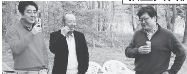
2013年5月に安倍首相(左)の別荘で撮影された写真。加計理事長(中央)、萩生田光一官房副長官(右)らとバーベキューをした

首相の意向で行政がゆがめられたのでは?—「加計学園」の獣医学部新設をめぐる疑惑で、首相最側近・萩生田光一官房副長官に關与の疑いが浮上しています。