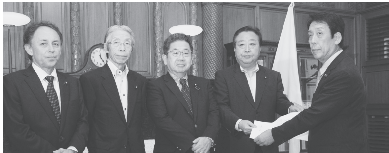
臨時国会召集要求書を川端達夫衆院副議長(右)に提出する(左へ)民進党・野田佳彦幹事長、日本共産党・小池晃書記局長、社民党・又市征治幹事長、自由党・玉城デニー幹事長=22日、国会内

「加計学園」疑惑の「幕引き」を図ろうとする安倍政権に対し、共産、民進、自由、社民の4野党は22日、安倍首相あての臨時国会召集要求書を衆参両院に提出しました。