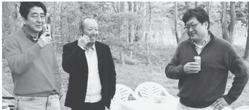
安倍首相(左)、加計理事長(中央)、萩生田光一官房副長官(右)=13年5月、安倍氏の別荘で