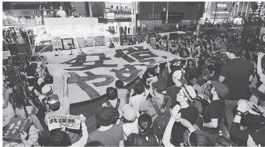
「安倍やめろ」のコールとともに巨大な横断幕が登場。9日、東京・新宿駅東口

都議選の最中、自分に抗議する市民を指して「こんな人たちに負けられない」と言った安倍首相。自分らにたてつく者には徹底攻撃。一方、「森友学園」「加計学園」では、「お仲間」に異常