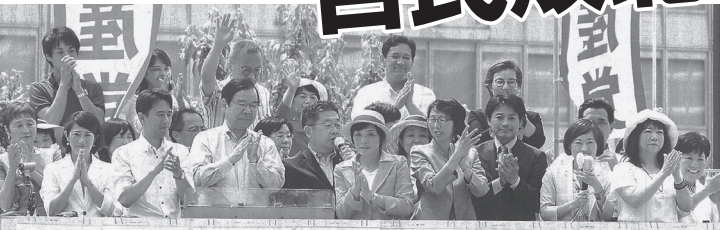
東京都議選結果を報告する 共産党の緊急街頭演説会 7月3日、東京・新宿駅西口