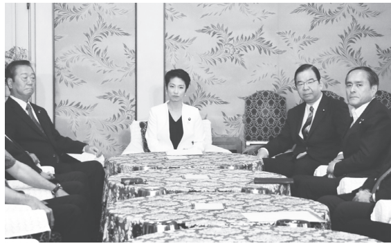
（左から）自由党・小沢一郎 共同代表、民進党・蓮舫代表、日本共産党・志位和夫委員長、社民党・吉田忠智代表 6月8日