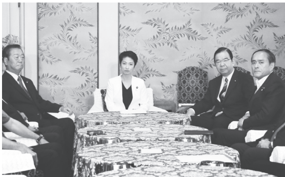
（左から）自由党・小沢一郎 共同代表、民進党・蓮舫代表、日本共産党・志位和夫委員長、社民党・吉田忠智代表 6月8日