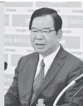
記者会見する共産党 志位和夫委員長 11月22日夜