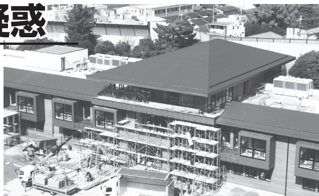
「森友学園」の小学校建設現場=大阪府豊中市