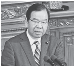
代表質問する志位和夫委員長=21日、衆院本会議

開会中の特別国会で日本共産党の志位和夫委員長（衆院議員）、山下芳生副委員長（参院議員）は衆・参院代表質問に立ち、安倍首相の姿勢をただし、日本共産党の対案を示しました。