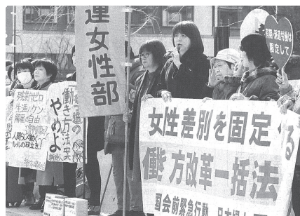
「働き方改革」一括法案に反対して行われた緊急国会前行動。2月28日

安倍首相は、今国会に提出を狙う「働き方改革」一括法案から裁量労働制拡大を削除すると表明しました。データねつ造、裁量労働制拡大の危険性を告発してきた野党6党の結束した論戦、国民世論の勝利です。