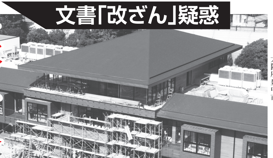
「森友学園」の小学校建設現場 大阪府豊中市