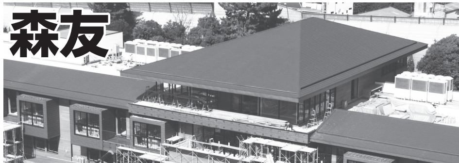
「森友学園」の小学校建設現場＝大阪府豊中市