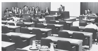
野党欠席のなかで審議が行われる衆院厚生労働委 2日

● 法案提出の資格なし 「働き方改革」法案は安倍政権の今国会の目玉。ところが法案の骨格である裁量労働制の拡大はデータねつ造が発覚し削除。野