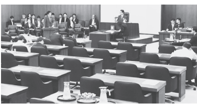
野党欠席のなかで審議が行われる衆院厚労委 2日

● 法案提出の資格なし 「働き方改革」法案は安倍政権の今国会の目玉。ところが法案の骨格である裁量労働制の拡大はデータねつ造が発覚し削除。野