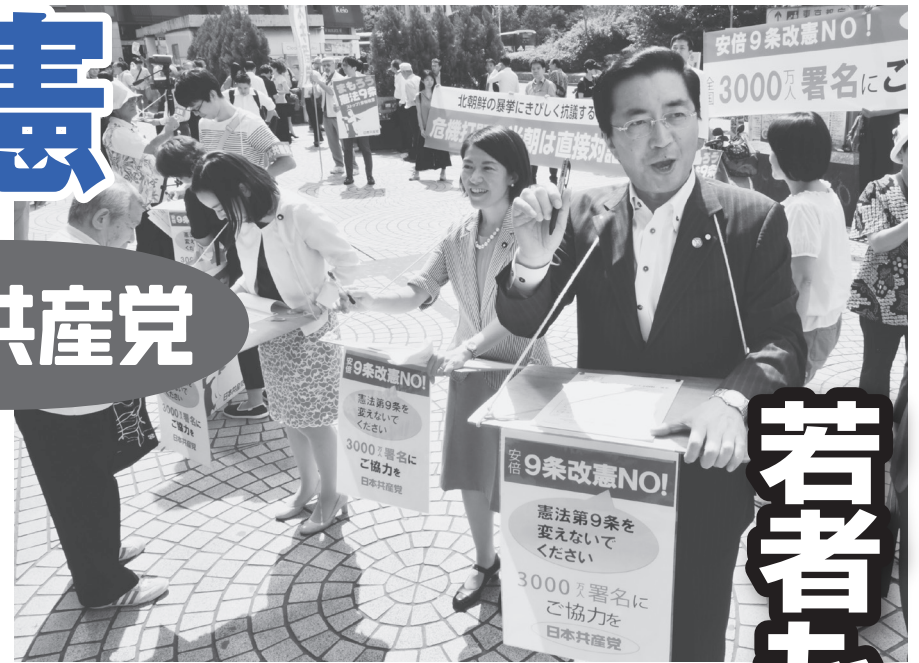
9条改憲反対の署名を訴え(右は山下よしき参院議員・党副委員長)