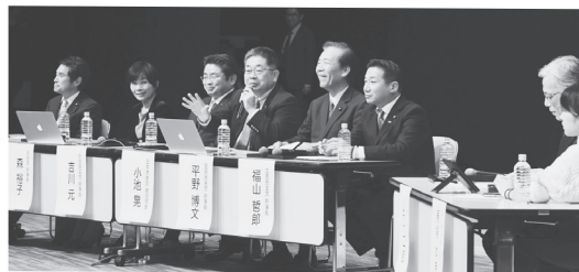
討論する6野党・1会派の書記局長・幹事長=18年11月28日

今年は統一地方選挙と参議院選挙の年。ウソと隠べいが極まった安倍政治にサヨナラするチャンスです。カギは野党の共闘の成否です。