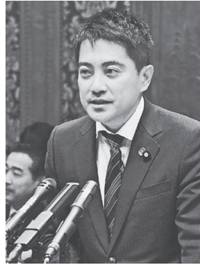
質問する辰巳孝太郎参院議員 11月5日、予算委員会