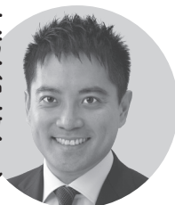
たつみ 孝太郎 参院議員