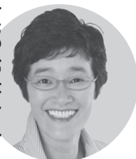
倉林 明子 参院議員