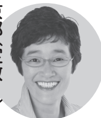
倉林 明子 参院議員