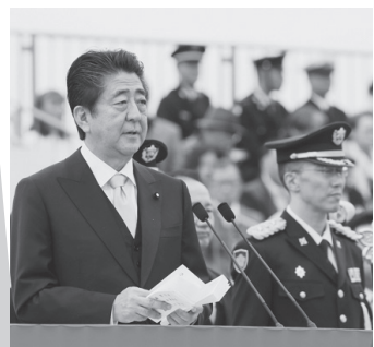
自衛隊記念日観閲式で（18年10月14日）

安倍首相が改憲の旗を振れば憲法違反になるが、安倍首相が旗を振らなければことが進まない—。ここに安倍改憲の致命的弱点があります。