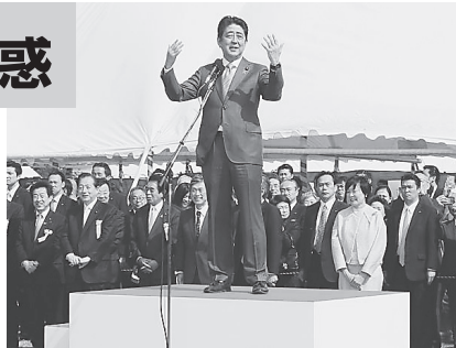
「桜を見る会」で参加者を前にあいさつする安倍首相。2017年4月15日、首相官邸公式ウェブサイトから

安倍政権を揺るがす大問題に発展した「桜を見る会」疑惑。衆参両院の野党「追及チーム」による追及で明らかになったことは…。