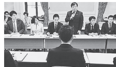
「桜を見る会」野党追及本部のヒアリング=11月27日、国会内

マルチ商法「ジャパンライフ」元会長の招待状には、総理推薦枠とみられる区分番号「60」が。当初政府は認めませんでした。野党の追及と世論に押され、11月末ついに区分番号「60」が記載さ