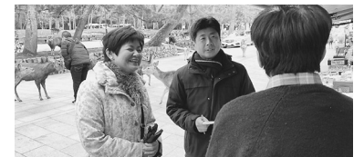
観光への影響を調査する共産党奈良県議員団=17日、奈良市内

「客足は8割減」「予約がまったく入らず心配」「インバウンド向けバスがピタッと止まって仕事がない」—観光業やバス労働者などから悲痛な声が寄せられています。日本共産党は、打撃を受ける産業への対策を強めよと、各地方議員団と国会