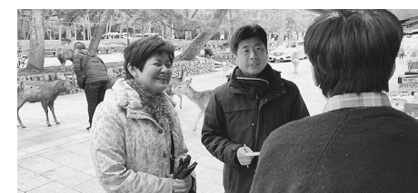
観光への影響を調査する共産党奈良県議員団=17日、奈良市内

「客足は8割減」「予約がまったく入らず心配」「インバウンド向けバスがピタッと止まって仕事がない」—観光業やバス労働者などから悲痛な声が寄せられています。日本共産党は、打撃を受ける産業への対策を強めよと、各地方議員団と国会