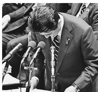
自らのヤジで謝罪する安倍首相=17日、衆院予算委