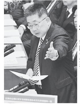
質問する小池晃書記局長。23日、参院予算委