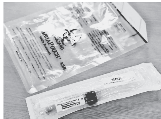
新型コロナウイルスのPCR検査で検体採取に使う綿棒、一次容器(手前)と二次容器(奥)=見本

既に感染経路の分からない感染者が多数になっており、集団感染(クラスター)を追跡するこれまでの検査方式は限界です。必要な検査を大規模に行う体制への転換が急務です。