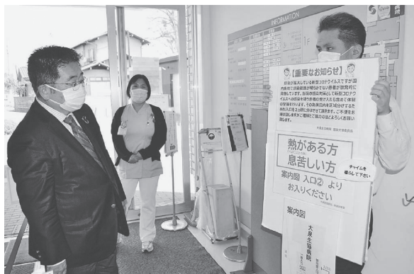
発熱外来について説明を受ける共産党・小池晃書記局長(左) 東京都練馬区内の病院

医療崩壊は既に始まりつつあります。食い止める決定的な力ギは、検査体制の抜本的強化、医療現場への本格的な財政支援です。補正予算案では、医療支援はわずか1500億円。共産党は関連予算を数兆円規模に拡大し、医療崩壊を止めるあらゆる手立てを求めます。