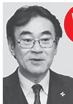
賭け麻雀 黒川弘務氏