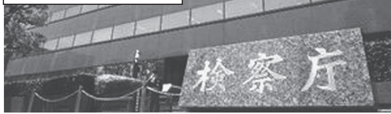
検察庁 東京都千代田区