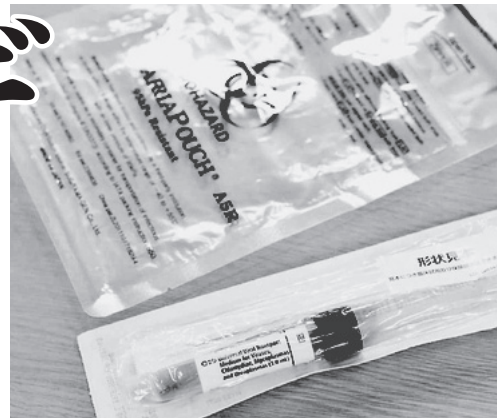
新型コロナウイルスのPCR検査で検体採取に使う綿棒、一次容器(手前)と二次容器(奥)=見本

く(グラフ)、このもとでの解除には懸念が残ります。感染拡大防止と経済活動再開を両立させるカギは検査体制の抜本的強化です。