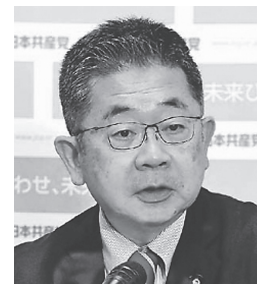
記者会見する小池晃書記局長 13日、国会内