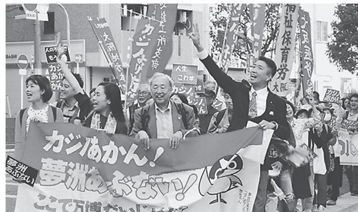
「カジノあかん!」とパレードする参加者(前列右は清水ただし衆院議員) 2019年10月、大阪市

政府の「骨太の方針」原案で、2014年以来毎年、「成長戦略」として取り上げられてきたIRの記述が削除されました。しかし安倍首相はIRを「観光先進国の実現を後押しする」としがみついています