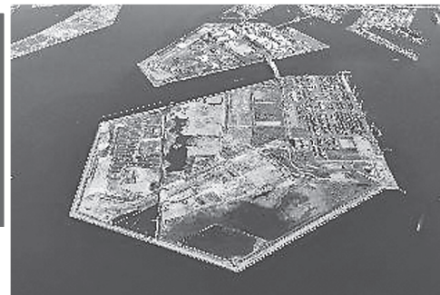
▶夢洲全景