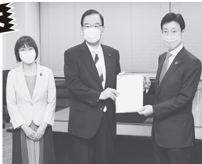
感染震源地での集中検査を政府に申し入れる志位和夫委員長（中央）と田村智子政策委員長（右）7月28日、内閣府

感染拡大が止まりません。ところが政府はなんの対策もとらず、自治体まかせ。国民には“旅行や帰省は自分でよく気をつけて”というだけです。