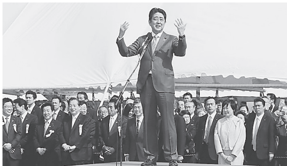
「桜を見る会」で参加者を前にあいさつする安倍首相。2017年4月15日、首相官邸公式ウェブサイトで

応策を出す遅さ。それどころが「GoToキャンペーン」を前倒し実施。この下で沖縄での感染拡大が重大化しています。