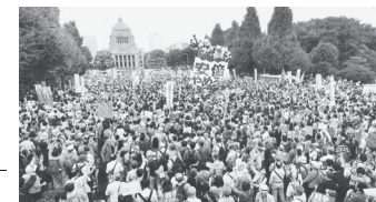
国会を取り囲み戦争法廃案を求める人々。2015年8月