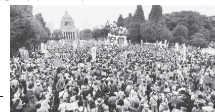
国会を取り囲み戦争法廃案を求める人たち。2015年8月