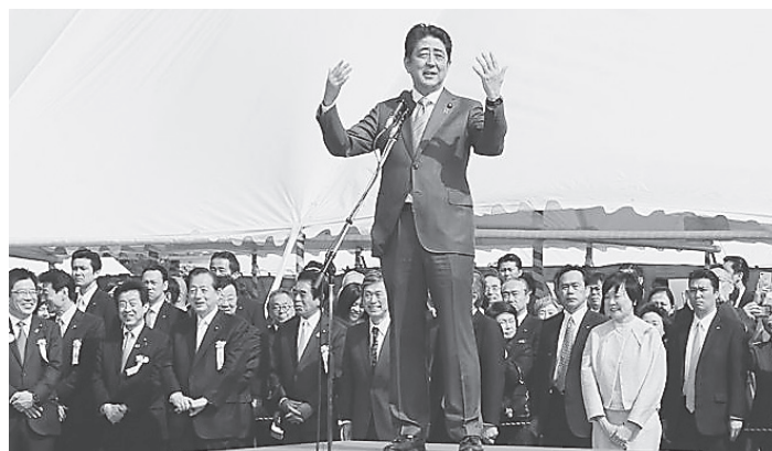
「桜を見る会」で参加者を前にあいさつする安倍首相。2017年4月15日、首相官邸公式ウェブサイトで

消費税増税2回も 暮らし悪化、景気破壊を省みず2回の消費税増税。13兆円もの負担を押し付け。