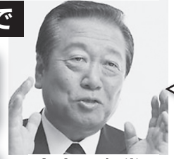
立憲民主党 小沢衆院議員