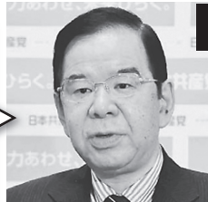
共産党 志位 委員長