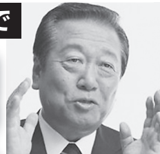
立憲民主党 小沢 衆院議員