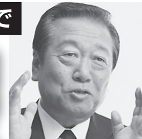
立憲民主党 小沢衆院議員