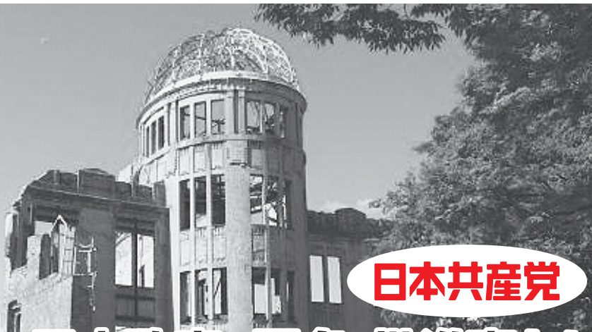
広島市・原爆ドーム(現在、保存工事中)