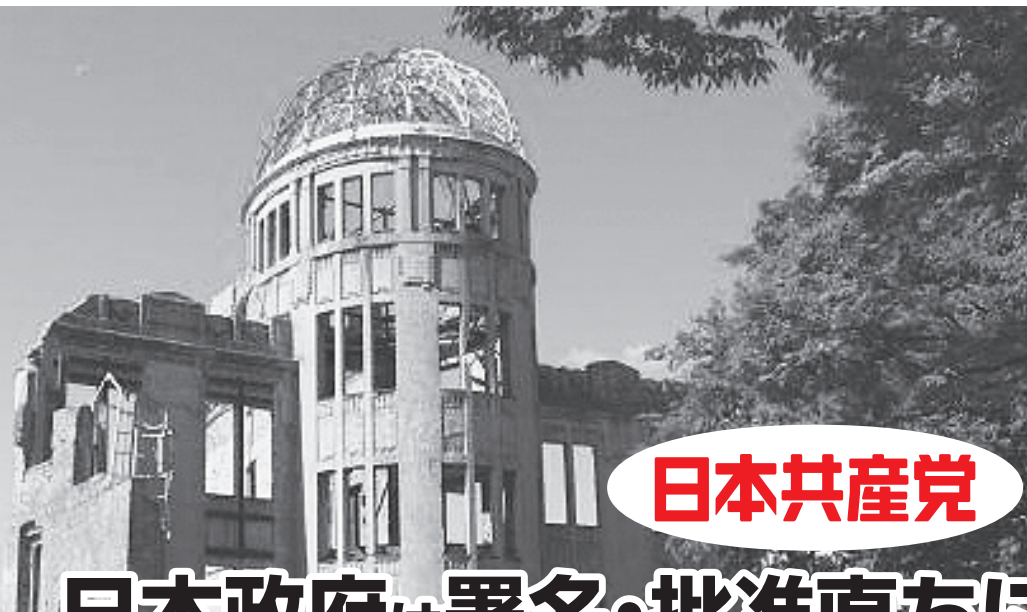
広島市・原爆ドーム(現在、保存工事中)