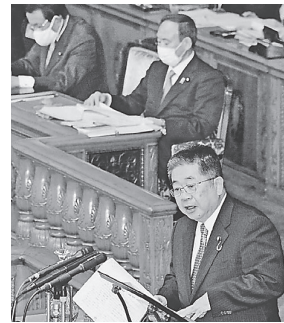
参院で代表質問する小池氏＝10月30日