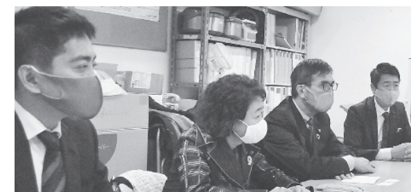
医療従事者と懇談する共産党国会議員ら 11月27日、大阪市