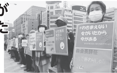
「わかまえない女たちのアクション」でアピールする女性たち 12日、大阪市・淀屋橋

この問題では多くの女性が「私もわかまえさせられてきた」と発信し、「沈黙しない」と国民が声を上げました。「女性だから」「男性だから」と生き方を押し付けられ