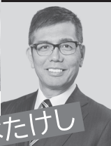
前衆院議員 宮本たけし