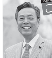
衆院議員・党国対委員長 こくた恵二