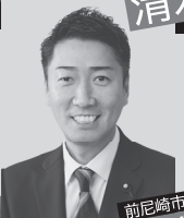
衆院議員 清水ただし