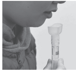
だ液によるPCR検査11日

「新型コロナ感染者が減少傾向にある今こそ検査拡充を」— 共産党の志位和夫委員長は、新規感染者の減少に伴うPCR検査数の大幅減少を「強く危惧している」と表明。「検査能力に余裕がある今こそ、検査の思い切った拡充でコロナを抑え込むべきだ」と主張しました(12日)。 失敗繰り返させぬ