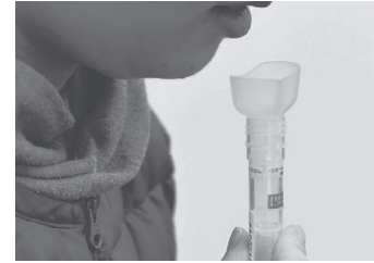
だ液によるPCR検査 毎日 本共産党ホームページより

①なぜ2週間なのか、2週間で何をするか、中身がまったく示されていません。これでは「後手批判」をかわすための演出と言われても仕方がありません。