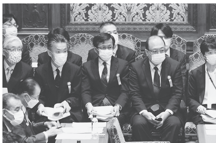
接待疑惑で参考人として出席した総務省幹部ら（2月25日、参院予算委）

なぜ総務省が見過ごしたのか。高額接待の見返りではなかったのか、正剛氏の父・菅首相への忖度はなかったのかなど、疑惑は深まるばかりです。