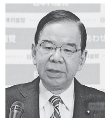
会見する志位氏(1日)

共産党の志位和夫委員長は「第4波」の封じ込めへ「あらゆる手だてを講じるべき」として①十分な補償②大規模な検査③医療機関への減収補てん④東京オリ・パラの中止決断への4点を政府に求めました。