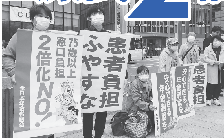
75歳以上の窓口負担2倍化反対を訴える人 たち。3月25日、東京

国会で審議中の「高齢者医療費2倍化法案」で窓口2割負担になるのは単身では年収200万円以上。決してお金持ちではありません。