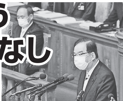
内閣不信任案に賛成討論する菅内閣と夫委員長 15日、衆院本会議