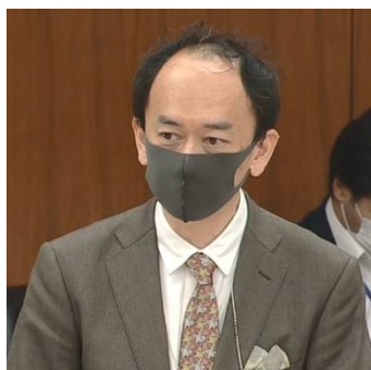
奈須野太中小企業庁事業環境部長(当時)

【奈須野太中小企業庁事業環境部長(当時)】「どのような資料で、十分に代替が可能であるかは、まさに個別に慎重に検討を行う必要がある」