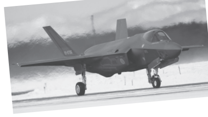
長距離巡航ミサイルを搭載する最新鋭ステルス戦闘機 F35A